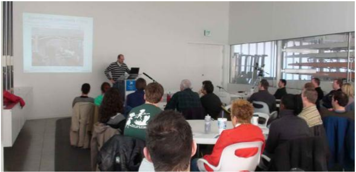
Во время проведения семинара по биомеханике гребли.