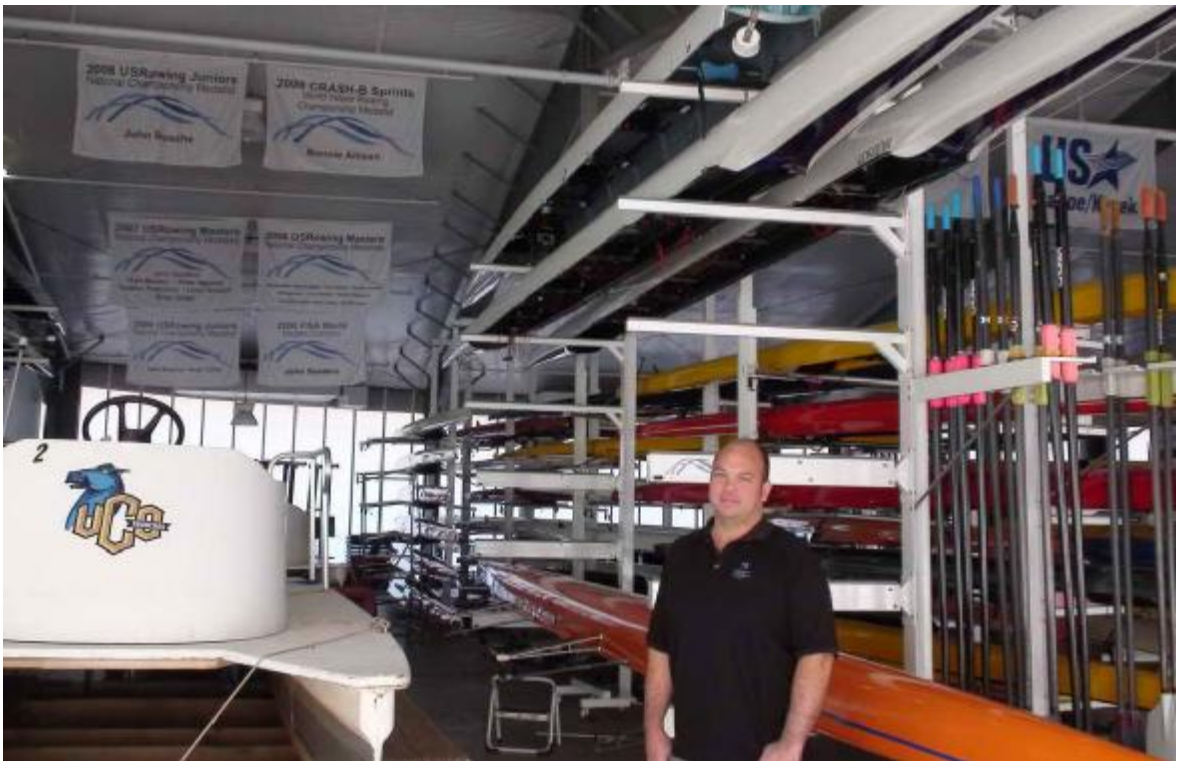
Национальный тренер Джон Паркер в эллинге гребного клуба Чезапик.