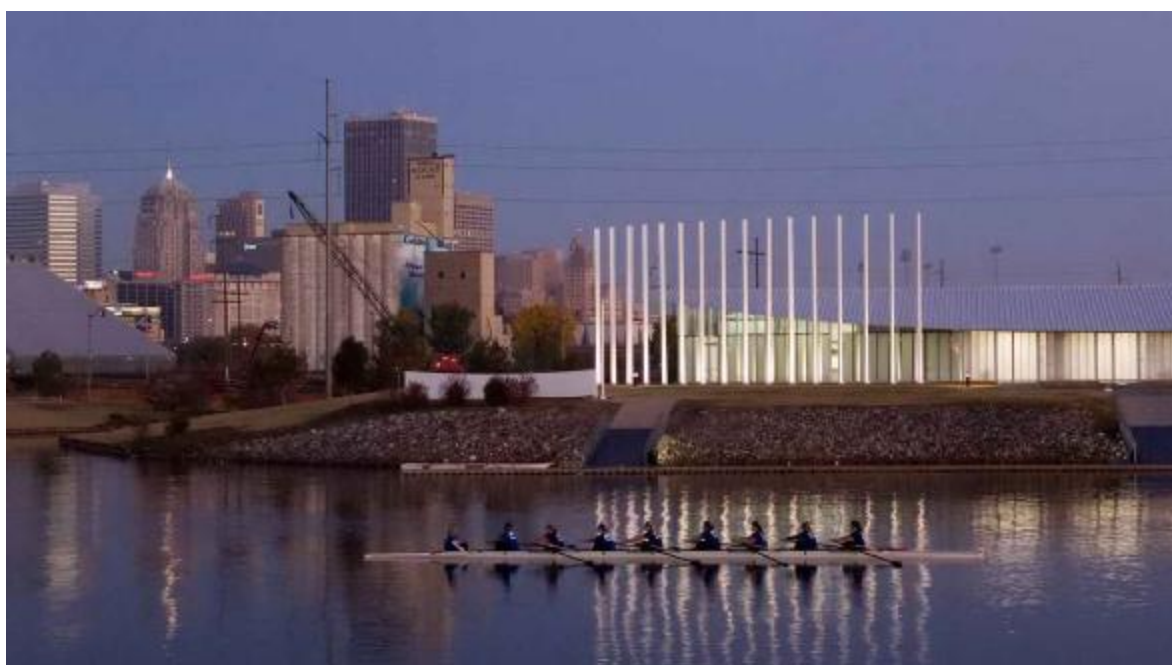
Так выглядит уже построенный гребной клуб Чезапик на фоне центра Оклахомы. Слева – устье канала, который свяжет водно-спортивную зону с «кирпичным городом».