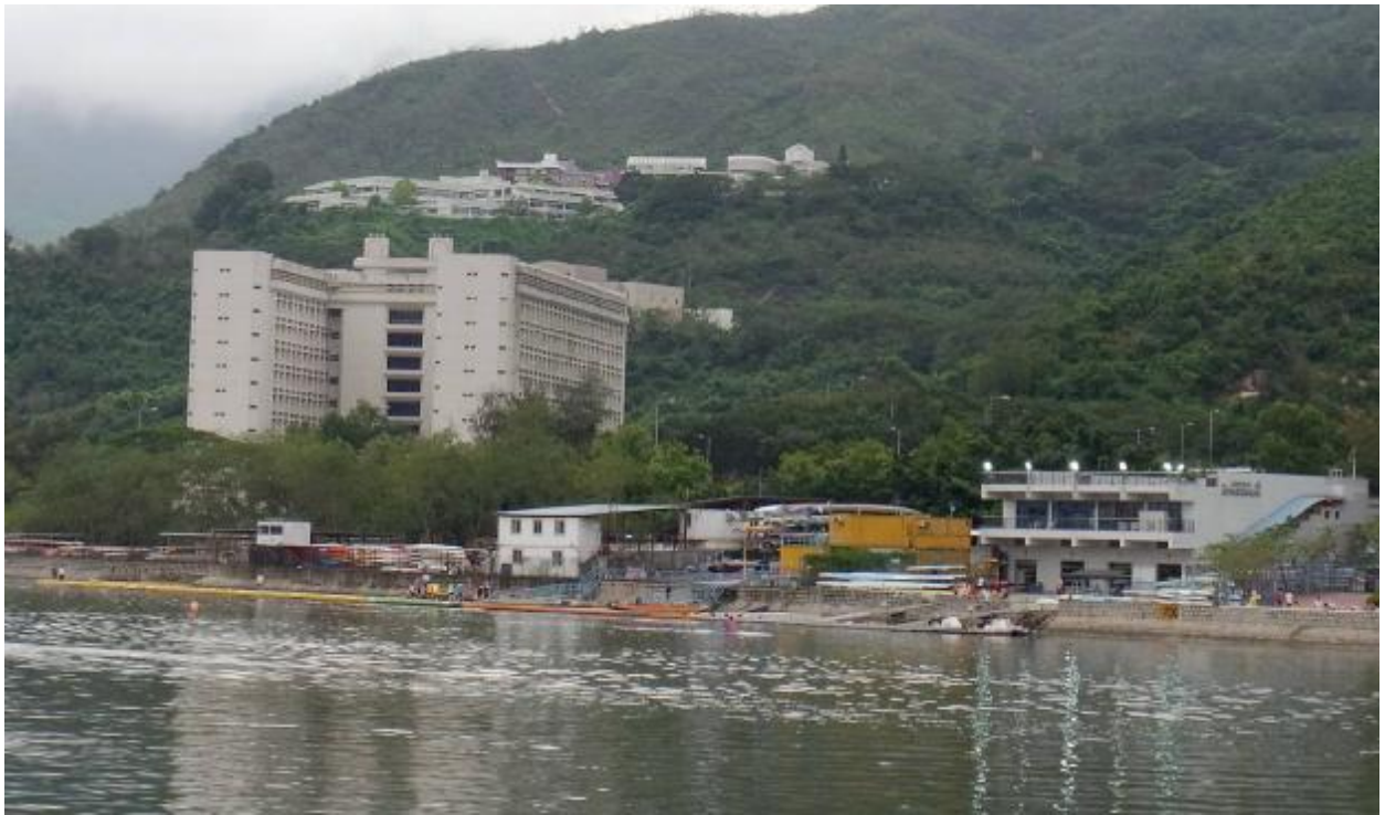
Гребной центр Шек-Мун является основной базой подготовки ведущих гребцов Гонгконга.