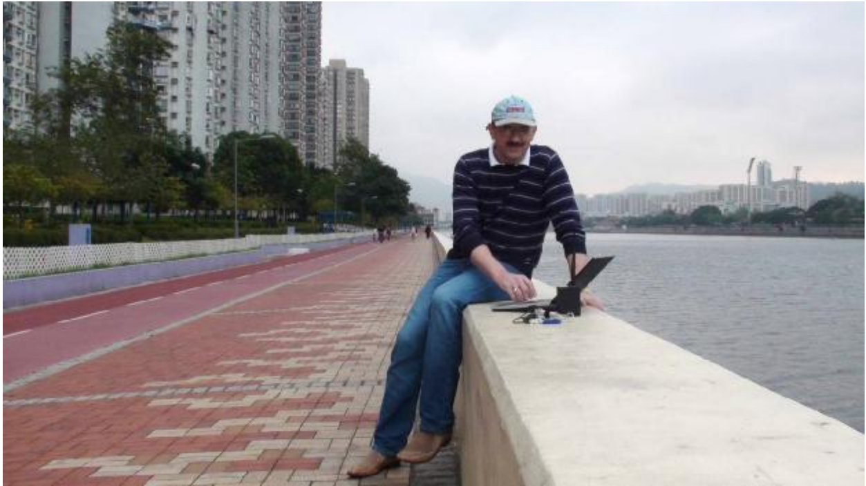
Во время тестирования на берегу канала Шинг-Мун