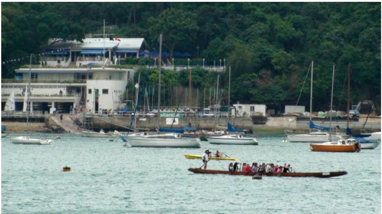
Королевский яхт-клуб Конгконга находится на небольшом островке Миддл-Айленд в бухте Репалс-Бэй – одном из самых фешенебельных районов Гонгконга. Остров никак не сообщается с большой землей, поэтому, чтобы попасть в клуб, нужно звонить в колокол и дежурный на катере перевозит посетителей. В клубе гребут на «драконах», байдарках и специальных морских академических лодках.