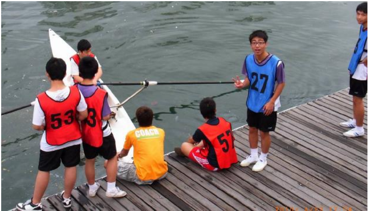
Номер 27, наверное, дает всем понять, что он обязательно победит, может быть на Азиатских Играх 2019 года.