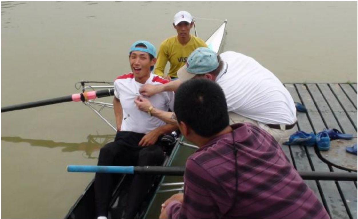
Этот китайский гребец уже приготовился проститься с жизнью в ходе экспериментов заморского мага биомеханики гребли. В этот раз ему повезло...