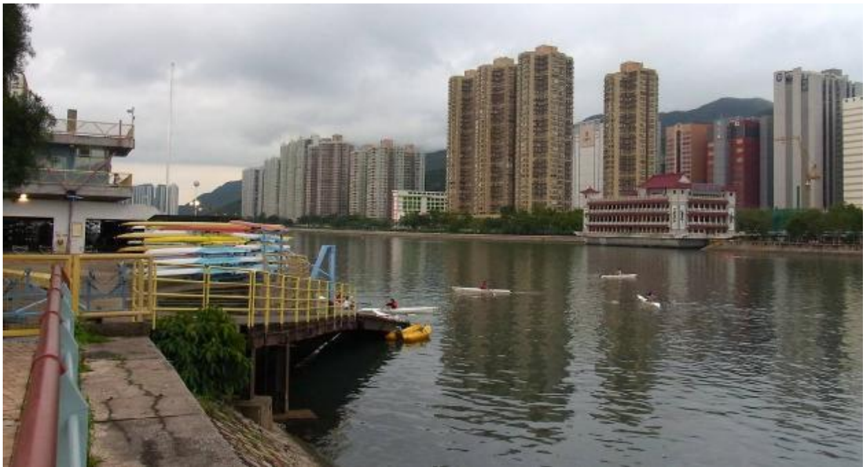
Гребной центр Ша-Тин на противоположном берегу канала Шинг-Мун специализируется на обучении новичков и подготовке резерва.