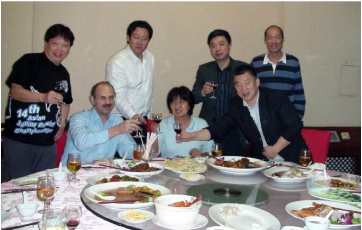
Китайские «товарищи» отличаются навязчивым гостеприимством, приходится «держать удар». Особенность традиционной китайской кухни - на столе куча всяких блюд, а есть, по сути, нечего – одни кости, хрящи в масле и специях, да маллюски в ракушках. Эх бы сюда щец со сметаной, да котлет с картошкой...