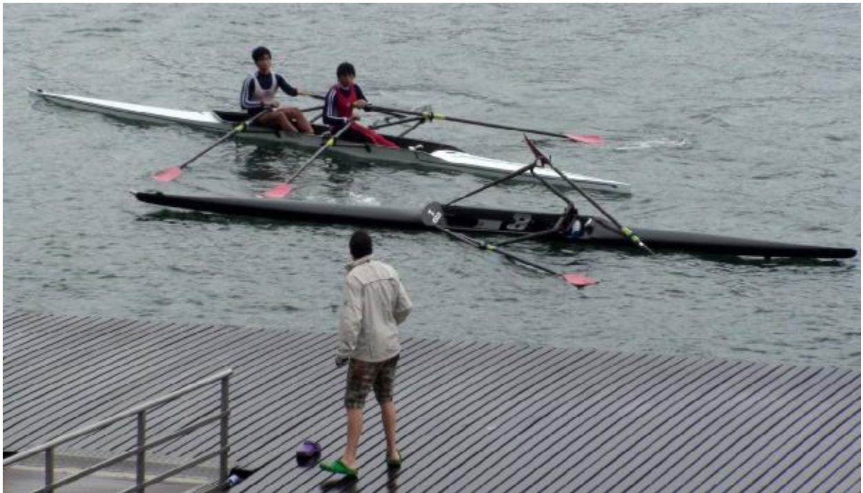
В Гонгконге, оказывается, лодки могут плавать без гребцов...;-)