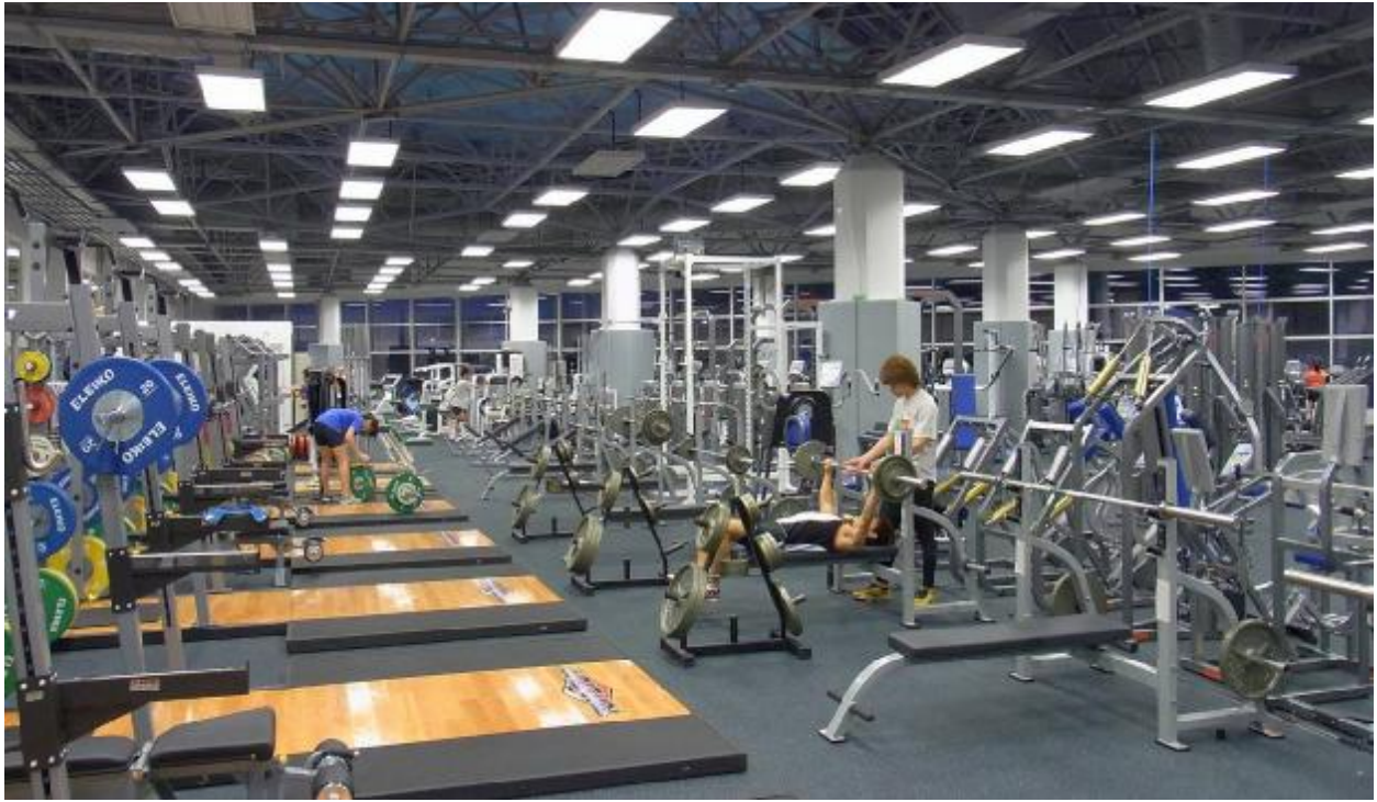
Прекрасно оборудованный зал силовой подготовки Института Спорта