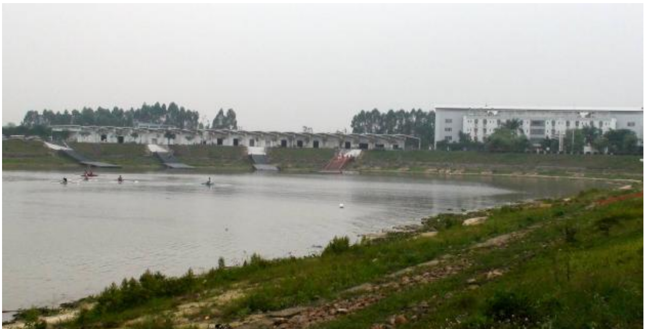
Водно-спортивный центр в китайском Гуанджоу будет принимать Азиатские игры в ноябре 2010 г. Гребной канал – очень неплохой, но пока испытывает трудности с уровнем воды, который на 1,5м ниже положенного.