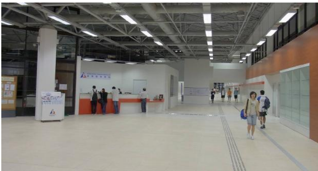
В помещениях Гонконгского Института Спорта – простор и стерильная чистота.