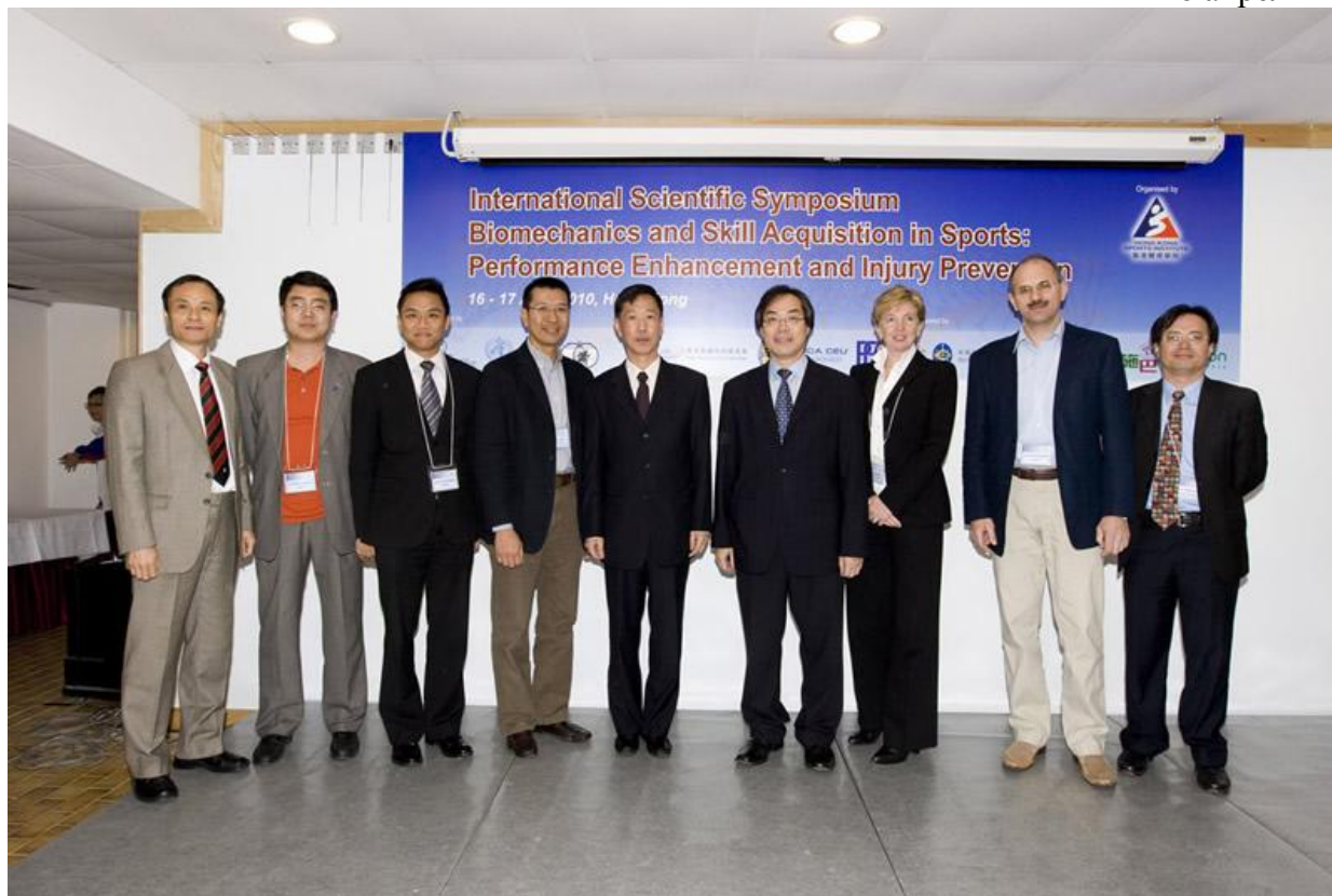
Участники Международного симпозиума в Гонконге по биомеханики и обучению навыкам в спорте.