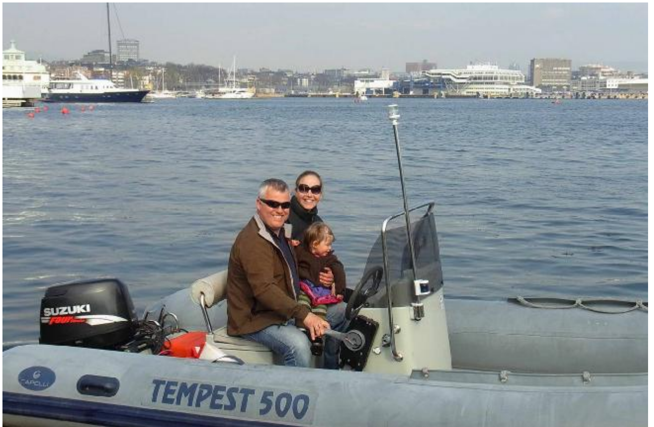
Тренеры клуба «Кристиания» перевезли нас на другой берег лагуны на своем рабочем катере.