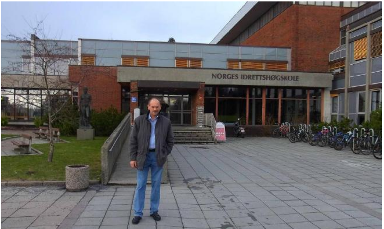
Перед входом в Норвежский Спортивный Университет. Здания были построены в 1960-х годах, выглядят еще достаточно прилично, но скоро будут реконструированы.