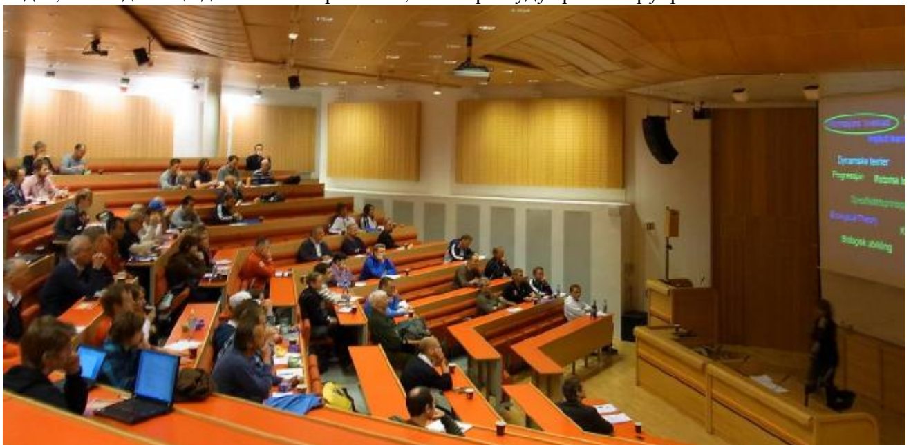
Во время проведения семинара по спортивной технике в Норвежском Спортивном Университете, Осло, 29 апреля 2010 г.