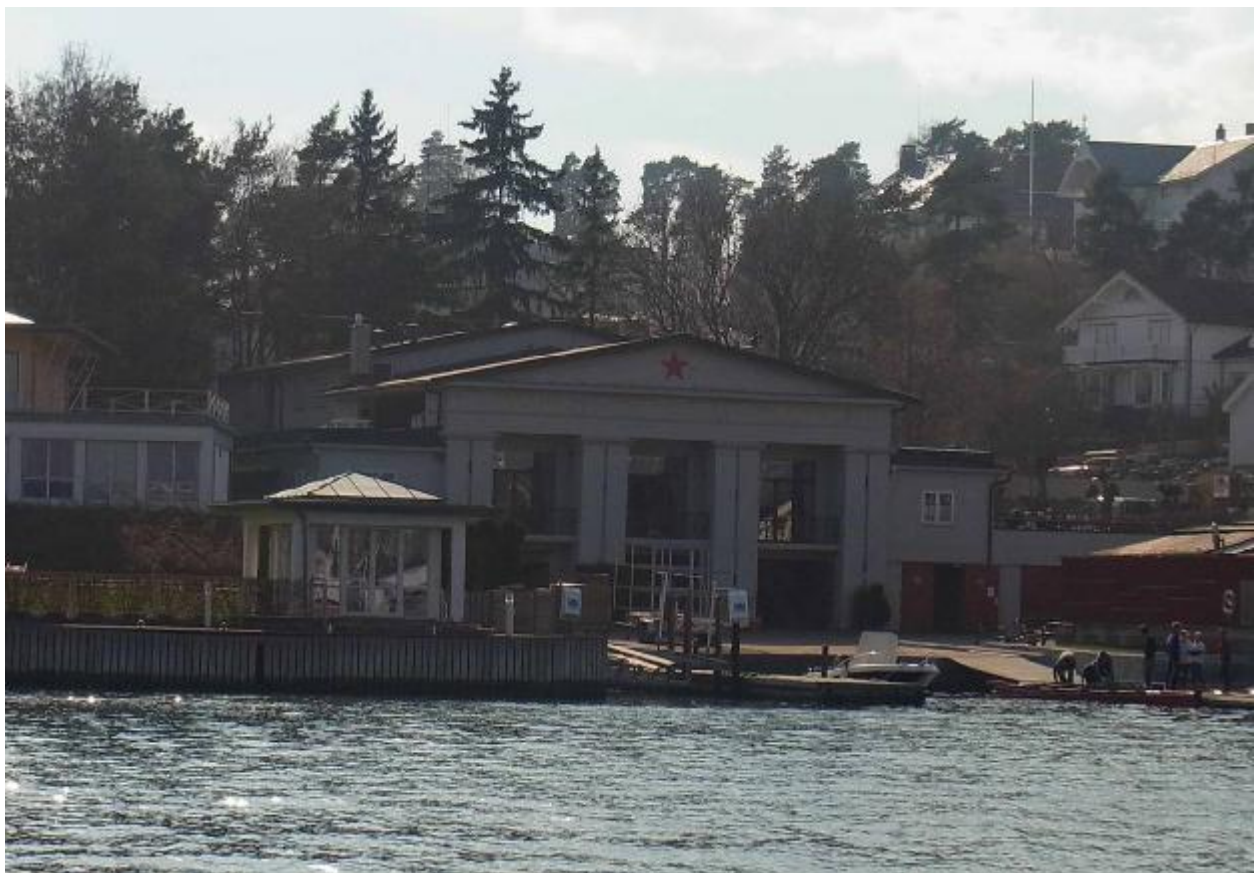
А на другом берегу фиорда– Норвежский студенческий гребной клуб «Красная Звезда».