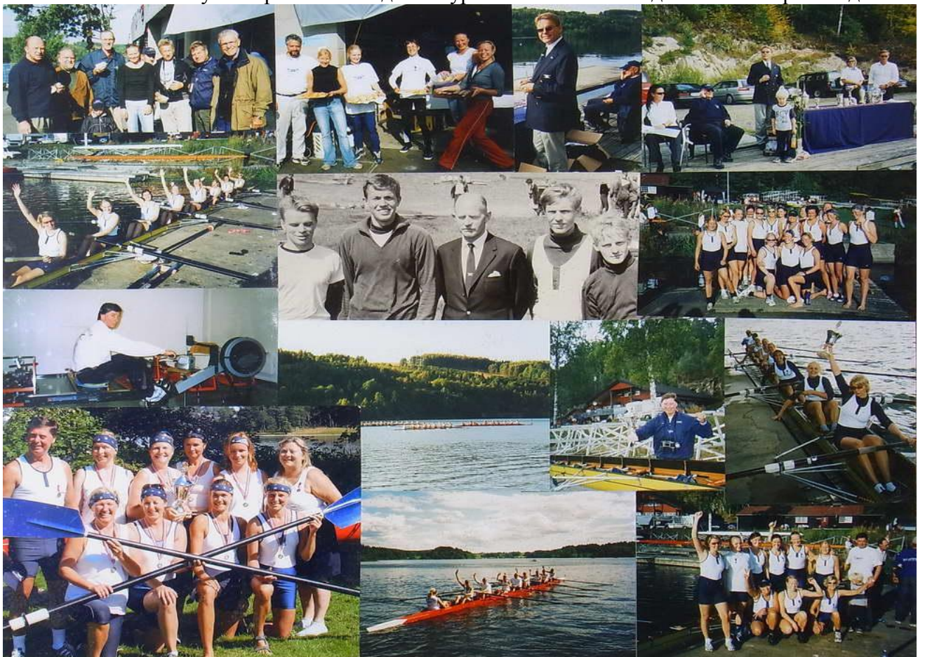
Постер с фотографиями членов клуба «Кристиания»