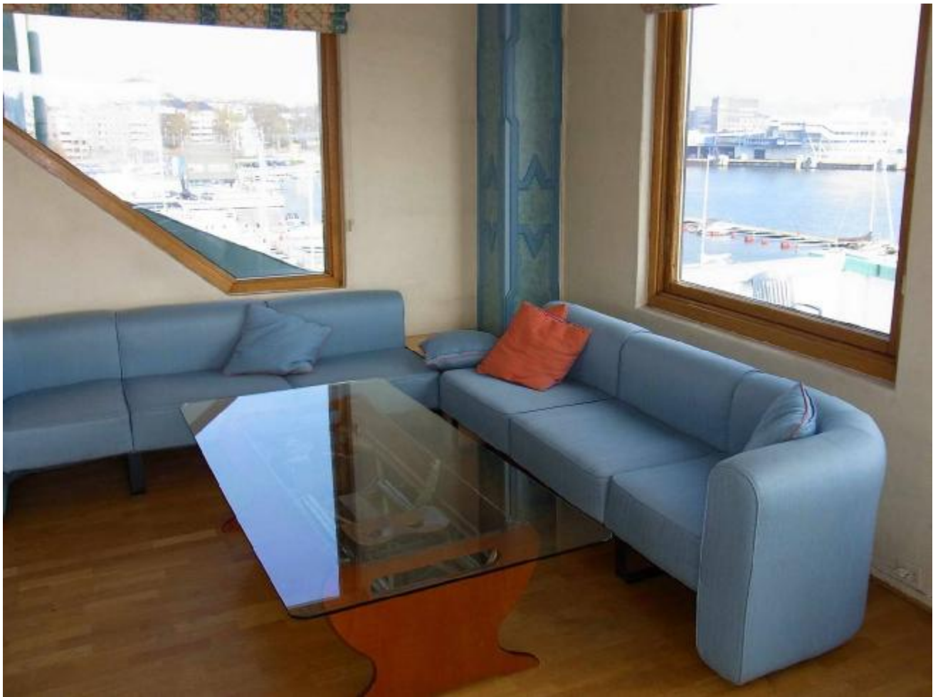
В кают-компаниях клуба «Кристиания» даже журнальные столики сделаны из старых лодок.